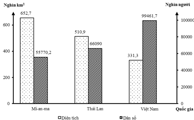
Biểu đồ diện tích và dân số của một số quốc gia Đông Nam Á năm 2022

(Nguồn: Niên giám thống kê ASEAN 2023, https://www.aseanstats.org )